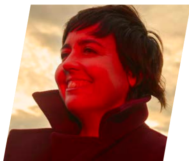
Ariane Moffatt