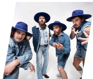
Bleu Jeans Bleu

À ce titre, la Fondation Musicaction, mandatée par le ministère du Patrimoine canadien, administrait, en 2021-2022, la portion francophone de deux volets du Fonds de la musique du Canada, les Initiatives individuelles et les Initiatives collectives . Les contributions des radiodiffuseurs privés ont permis de renforcer l'implication de la Fondation à l'intérieur de ces deux volets. De même, celle-ci gère, depuis 2002, le Fonds RadioStar destiné à la promotion et à la commercialisation de la musique francophone d'ici, un fonds financé à 100 % par les radiodiffuseurs privés. En 2018, une décision du CRTC fait de Musicaction le gestionnaire pour une période de quatre ans de nouveaux montants provenant des groupes privés de télévision afin de permettre d'optimiser l'offre et la promotion de contenu musical canadien par le Vidéoclip .