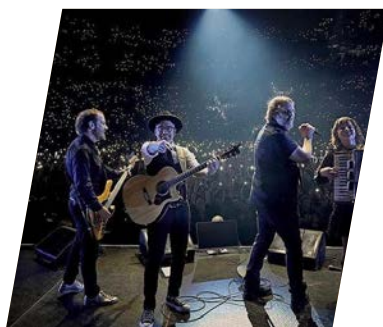
Les Cowboys Fringants