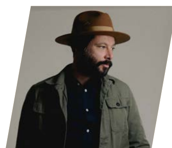
Tire le Coyote