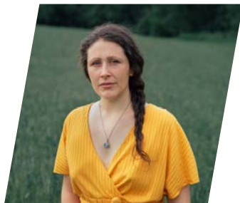
Belle Grand Fille