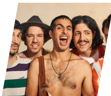
Clay and Friends