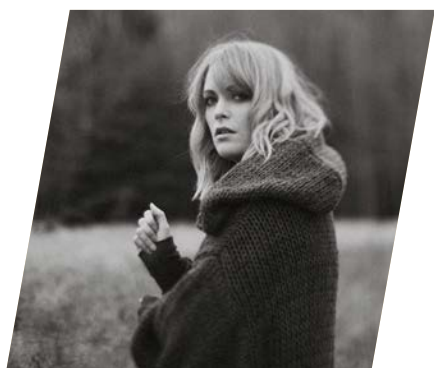
Andréanne A. Malette